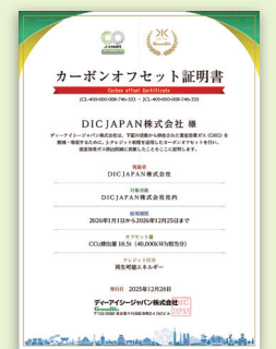
J-クレジット カーボンオフセット証明書

カーボンオフセットに取り組む加盟施設を利用すると、「脱炭素ポイント」がもらえる仕組み。 利用者は、施設に設置された二次元コードを読み取ることでポイントを獲得できます。 複数の加盟施設をめぐるながらポイントを貯める「ポイントラリー形式」のアプリです。 貯まったポイントは加盟施設で特典やサービスと交換できる設定となっています。 ※カーボンオフセットは、使用電力のCO 2 排出量が対象です。